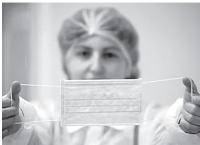
Заболееваемость ОРВИ в Ульяновской области идет на спад. На прошлой неделе врачи зарегистрировали 5513 случаев. Большая часть заболевших - дети.