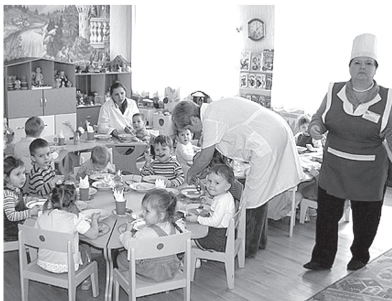
С 1 января 2016 года минимальная заработная плата сотрудников детсадов составит 6500 рублей

Также в повестке дня изменения в региональные законы «О размере вознаграждения, причитающегося приемному родителю, и льготах, предоставляемых приемной семье, в Ульяновской