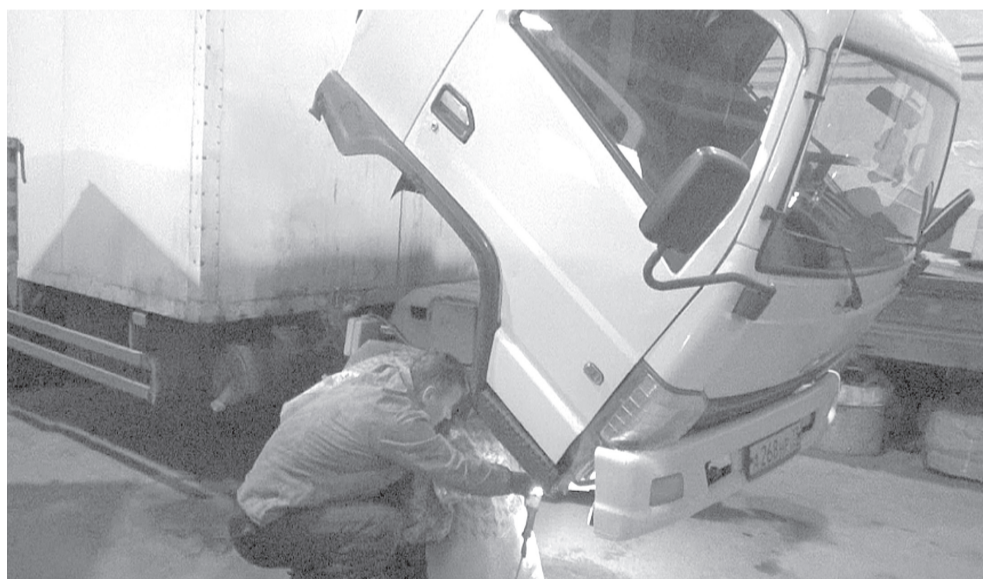
Уже трудоустроены более 100 осужденных

- Решение вопросов социальной реабилитации лиц, освобождающихся из мест лишения свободы, является одним из приоритетных направлений в деятельности уголовно-исполнительной системы. Статистика показывает, что, как правило, лица, освободившиеся из исправительных учреждений, испытывают трудности с трудоустройством. Это является одним из факторов повторной преступности. Созданный в нашем регионе Центр трудовой адаптации нацелен на решение социальных вопросов, включающих в себя трудоустройство, жилищные вопросы, юридические консультации и иную необходимую помощь лицам, освободившимся из мест лишения свободы, - комментирует руководитель пресс-службы УФСИН России по Ульяновской области Валентина Касьянова.