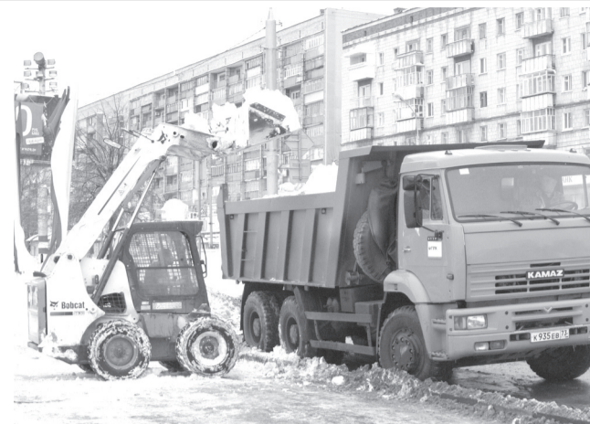
Дорожные службы Ульяновска продолжают устранять последствия снегопада. Так, в ночь с 17 на 18 ноября было вывезено порядка 500 тонн снега. Глава города Сергей Панчин обратился к жителям Ульяновска с просьбой не оставлять автотранспорт на дорогах.