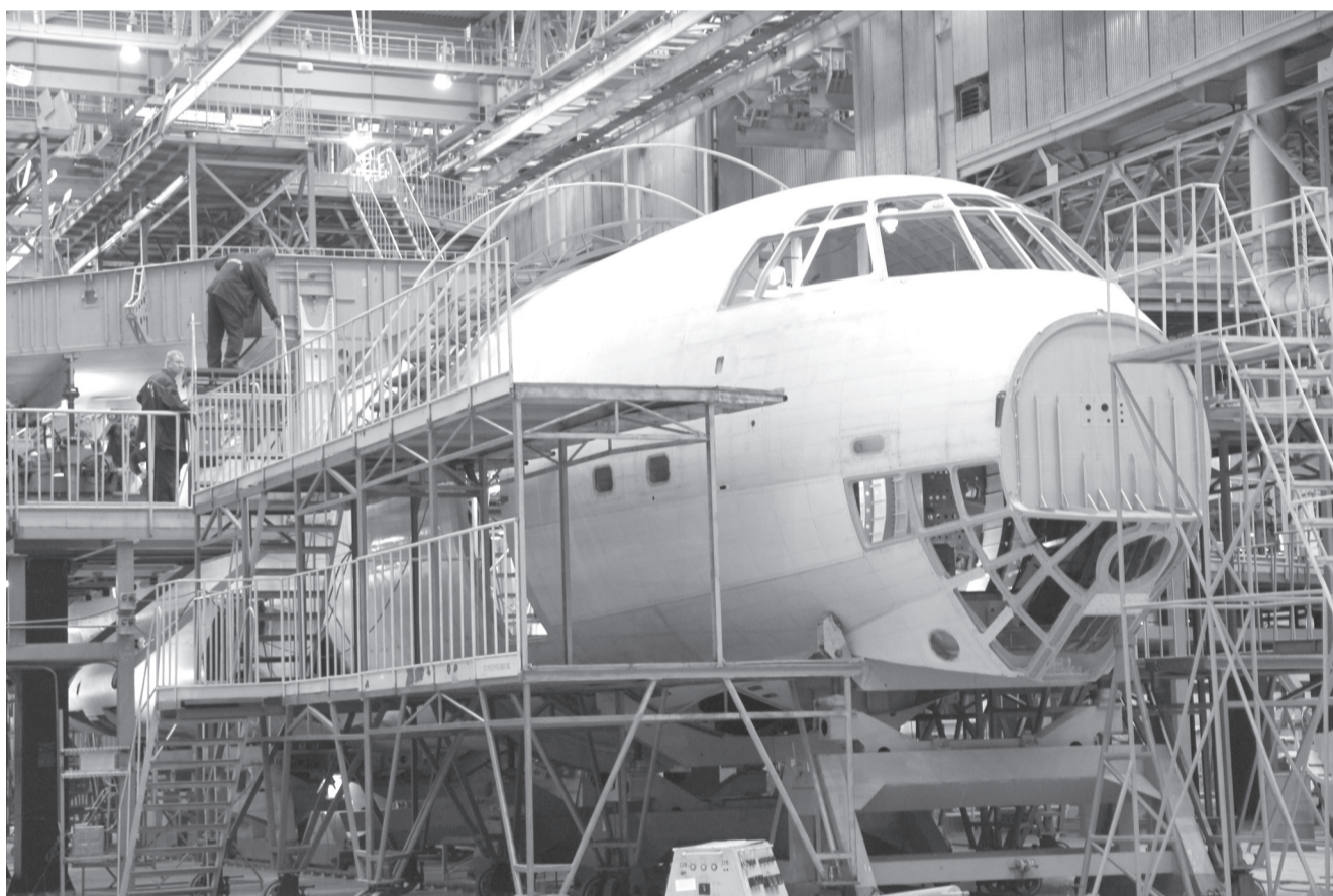
В 2016 году, вслед за военным транспортником Ил-76МД-90А и топливозаправщиком на его базе, в Ульяновске должны начать делать и гражданскую версию Ил-76ТД-90А

Также в ходе визита достигнута договоренность о проведении ремонта и обслуживания самолетов Ил-76, уже имеющихся в авиапарке МЧС, на базе дочернего предприятия «Авиастара» - Центра техобслуживания и развития. В ближайшее время в Ульяновске модернизируют и обслужат шесть Ил-76.