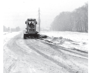
Работы 17 ноября на том самом школьном маршруте - подъезде к поселку Тимирязевский

- Все водители школьных автобусов имеют стаж работы в качестве водителя транспортного средства категории «D» не менее 1 года, - пояснили в министерстве. - Со всеми водителями школьных автобусов проводятся ежегодные занятия по повышению квалификации в организациях, имеющих на данный вид деятельности лицензию. В образовательных организациях подготовлены лицензированные медицинские